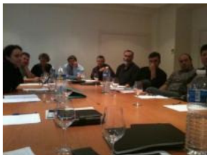
Réunion annuelle – Paris, 7 Janvier