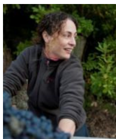
Erell - Vendanges 2010

Mas de Bagnols VDP des Coteaux de l'Ardèche Cotes du Vivarais