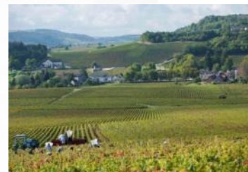
Domaine Ninot – Vendanges 2010

Dans les vignes, elle a modernisé les méthodes... en revenant en arrière : arrêt des herbicides, baisse des rendements et orientation progressive vers le bio. Erell attache une importance toute particulière au travail à la vigne et se veut très peu interventionniste lors des vinifications.